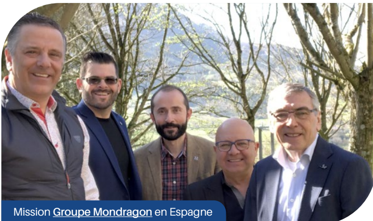
Mission Groupe Mondragon en Espagne