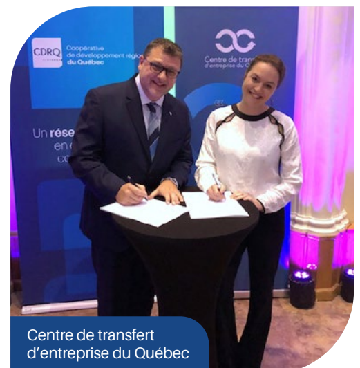
Centre de transfert d'entreprise du Québec